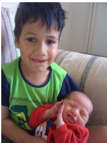
Een 5-jaar oude jongen met mozaïek trisomie 8 en zijn zusje met een normaal chromosomenpatroon.

“ Onze dochter is gek op dieren en televisie. Wanneer ze bij meerdere spelende kinderen is, speelt ze het liefst alleen. Ze vraagt ze wel om met haar mee te doen, maar verder is er weinig interactie. Ze is dol op het doorbladeren van