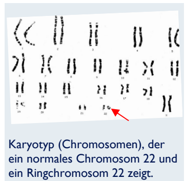
Karyotyp (Chromosomen), der ein normales Chromosom 22 und ein Ringchromosom 22 zeigt.

Wenn man den Bruchpunkt im kurzen Arm kennt, nützt das nicht viel, aber ihn beim langen Arm zu kennen, kann sehr hilfreich sein, besonders, wenn man erkennen kann, ob SHANK3 fehlt oder nicht. In einem Fall hatte eine Frau mit dem Ringchromosom 22 das SHANK3 -Gen nicht verloren und war nur sehr geringfügig betroffen. Im Endbereich des q-Arms von Chromosom 22 sind mehrere Gene, die möglicherweise eine Rolle in der neurologischen Entwicklung spielen, aber als dieser Text entstand (2005), war ihr Einfluss noch nicht geklärt.